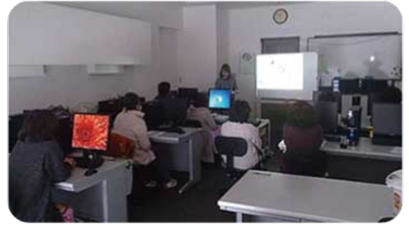
ゆとりのあるスペース。快適な環境で授業が受けられます。

PC倶楽部 熊野店 電話 0597-88-0655 〒519-4323 三重県熊野市木本町 633-2 (駐車場 あり)