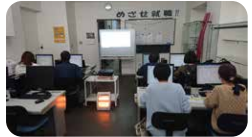
ゆとりのあるスペース。快適な環境で授業が受けられます。