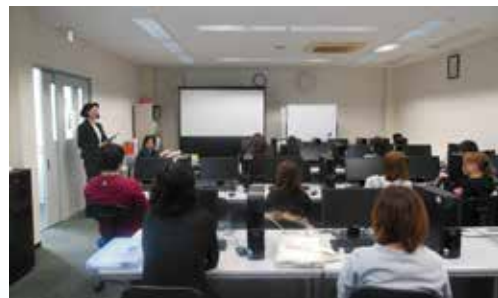
ゆとりのあるスペース。快適な環境で授業が受けられます。